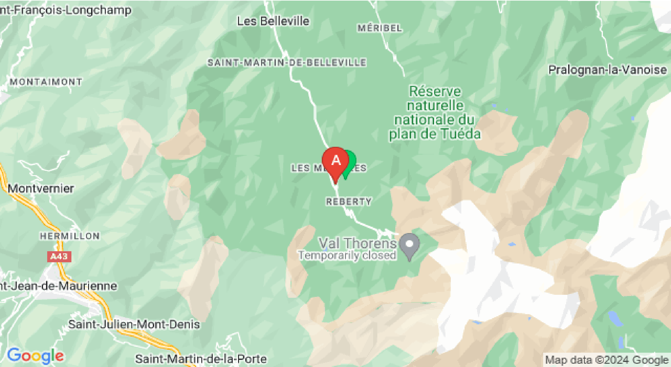
Map data ©2024 Google